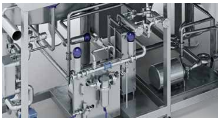
Gruppo tubazioni sala cottura e scambiatore di raffreddamento a singolo o doppio strato di facile accesso per manutenzione Brewhouse piping and single or double stage heat exchanger with easy access for maintenance