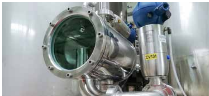
Specola Grant / Grant sight glass