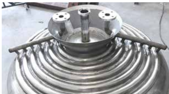
Fondo bombato per il tino impasto e caldaia ebollizione Dished bottom for mash and boiling tank