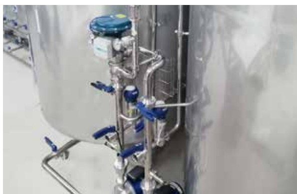
Gruppo pressurizzazione serbatoio acqua calda e acqua fredda Hot and cold water tank pressurization unit