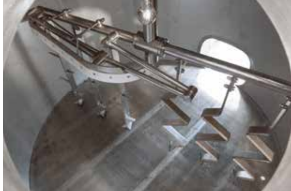
Interno tino filtro / Filter vat interior