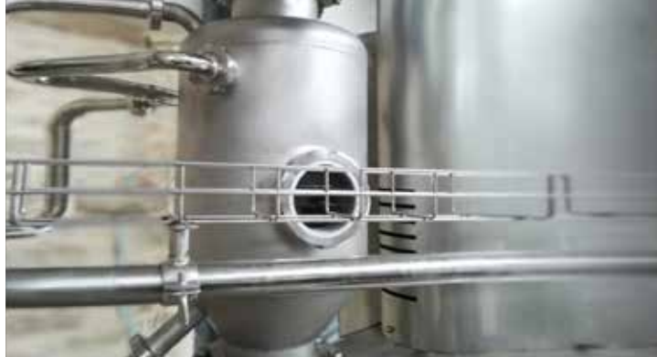
Iidratatore malto / Malt hydrator